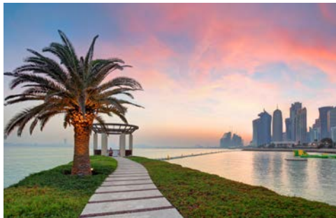
Die Promenade „Corinche“ in Doha

bis zum futuristischen Viertel West Bay, in dem sich Architekten gegenseitig mit außergewöhnlichen Wolkenkratzern übertrumpfen wollen. An der Corinche sind einige der schönsten Museen von Katar angesiedelt, die nicht nur Kulturfreunde in ihren Bann ziehen. Zum Beispiel das 2008 eröffnete Museum für Islamische Kunst des bekannten Architekten I. M. Pei besticht schon von außen durch seine ungewöhnliche, sandsteinfarbene Gestalt. Im Inneren beherbergt es die Kunstschätze der Emire von Katar und spiegelt über 1.000 Jahre Kulturgeschichte der arabischen Region wider.