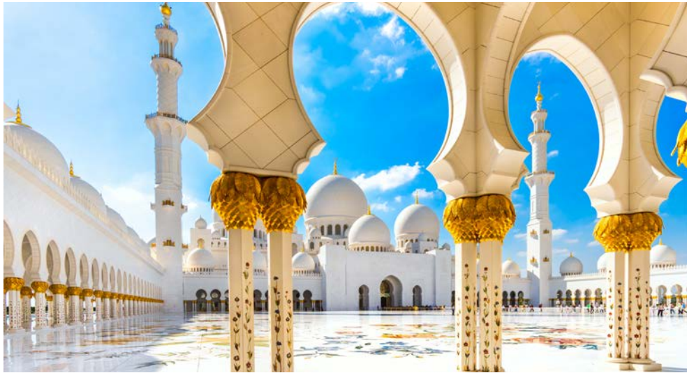
Abu Dhabi – Sheikh Zayed Moschee

bis zum futuristischen Viertel West Bay, in dem sich Architekten gegenseitig mit außergewöhnlichen Wolkenkratzern übertrumpfen wollen. An der Corinche sind einige der schönsten Museen von Katar angesiedelt, die nicht nur Kulturfreunde in ihren Bann ziehen. Zum Beispiel das 2008 eröffnete Museum für Islamische Kunst des bekannten Architekten I. M. Pei besticht schon von außen durch seine ungewöhnliche, sandsteinfarbene Gestalt. Im Inneren beherbergt es die Kunstschätze der Emire von Katar und spiegelt über 1.000 Jahre Kulturgeschichte der arabischen Region wider.