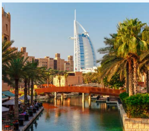
Der Burj Al Arab in Dubai