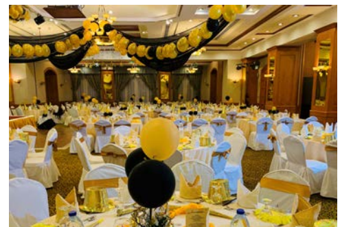
Silvester – der festlich geschmückte Hotel-Saal

Unternehmen Sie heute Erkundungen auf eigene Faust, die Stadt hat viel zu bieten. Am Abend feiern Sie in Dubai in das nächste Jahr. Im festlich geschmückten Hotel erleben Sie den Silvesterabend mit Gala-Dinner-Buffer inklusive einer Auswahl an alkoholischen und nicht alkoholischen Getränken und können zu der Musik eines DJ's in das neue Jahr tanzen.