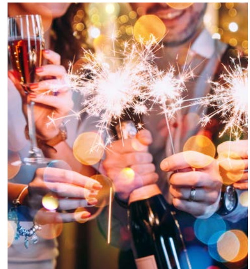
Silvester in Dubai

Am Spätnachmittag steht dann für Sie ein Ausflug in die Wüste auf dem Programm (sofern gebucht). In Geländewagen geht es in die Wüste, wo das Auf und Ab in den Dünen für ein ganz besonderes Erlebnis sorgt. Unvergesslich ist der Anblick des zauberhaften arabischen Sonnenuntergangs. Nach Ankunft im Beduinencamp erleben Sie einen arabischen Abend mit Bauchtanz und einem köstlichen Grillessen. Alles in allem ein unvergesslicher Abend.