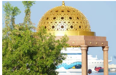
AIDA in Maskat

Das umfangreiche AIDA Ausflugsprogramm verspricht heute besondere Erlebnisse zu Wasser, per Rad oder in der Luft. Für eine individuelle Entdeckungstour empfehlen wir den Besuch des Museum of the Future, das bereits durch seine futuristische Architektur besticht oder den Besuch von Miracle Garden, ein Blumenpark der Superlative, in dem selbst ein ganzes Flugzeug mit Blumen bepflanzt wurde. Langeweile werden Sie in Dubai sicher nicht haben!