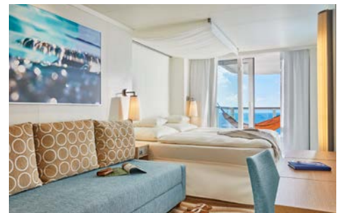
Eine Veranda Kabine an Bord der AIDAcosma

Willkommen 2023! Genießen Sie ein entspanntes Neujahrs-Frühstück im Hotel bevor es gegen Mittag Richtung Abu Dhabi geht, wo Sie AIDAcosma zur Einschiffung erwartet.