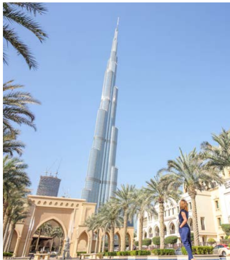
Blick auf den Burj Khalifa in Dubai