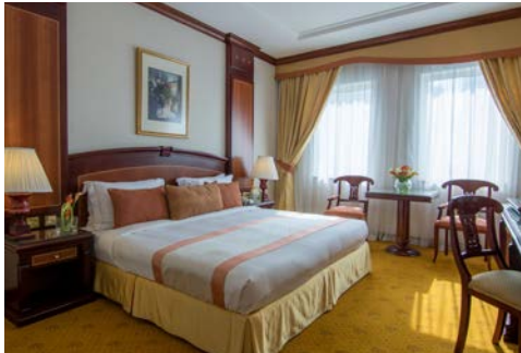
Zimmerbeispiel im Hotel