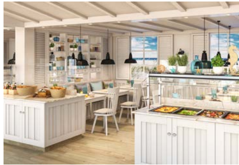
Beach House Restaurant an Bord

Das Carlton Palace Hotel empfängt Sie in zentraler Lage, in der bekannten Al Maktum Street im Herzen des Stadtteils Deira. Die Dubai Metro Stationen Al Rigga und Union sind in nur 10 Minuten zu Fuß erreichbar. Das Hotel verfügt über zahlreiche Annehmlichkeiten wie verschiedene Restaurants und Bars, einen Fitnessraum, eine Sauna, Dachterrasse mit Außenpool und Sonnenliegen sowie WLAN in den öffentlichen Bereichen. Die Zimmer verfügen über Klimaanlage, Bad oder Dusche/WC, Fön und TV. Zu den Mahlzeiten bedienen Sie sich am Buffet mit landestypischen und internationalen Spezialitäten.