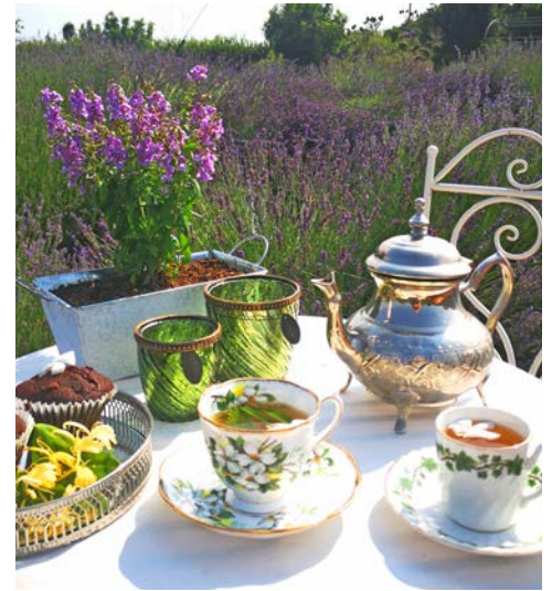
Genießen Sie eine Tasse Kräutertee im CyHerbia Garden

Heute besuchen Sie die letzte geteilte Hauptstadt Europas Lefkosia, wie der einheimische Name für Nikosia lautet. Der Besuch der prachtvollen Johannes-Kathedrale führt Sie zurück in die kulturelle Blütezeit der Stadt, die Nikosia im Mittelalter erlebte. Die restaurierte Altstadt Laiki Geitonia mit ihren verwinkelten Gassen, kleinen Läden und einladenden Cafés sowie die bekannte Ledra Street laden zum Flanieren und Bummeln ein. Zu Fuß gelangen Sie in den türkisch besetzten Teil der Stadt. Dort besichtigen Sie die Aya-Sophia-Kathedrale, den traditionellen Basar und die Karawanserei, einen orientalischen Handelsplatz, auf dem früher Kaufleute ihre Waren lagerten und ihre Pferde und Kamele versorgten. Anschließend besuchen Sie das prächtige Wohnhaus von Dragoman Hadjigeorgakis Kornesios aus dem 18. Jh. Im Osmanischen Reich war der Dragoman zweitwichtigster Mann in der belagerten Region, darüber stand nur der Pascha, ein hochrangiger Offizier des Militärs. Ein Dragoman fungierte dabei als Kontaktperson bzw. Übersetzer zwischen Pascha und Bevölkerung. Auf