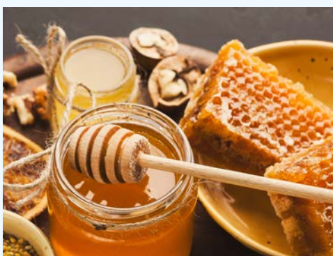
Freuen Sie sich auf eine exklusive Honig-Probe!