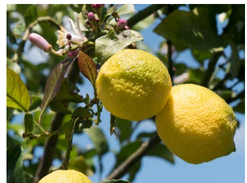
FrISChe zypriotische Zitronen!