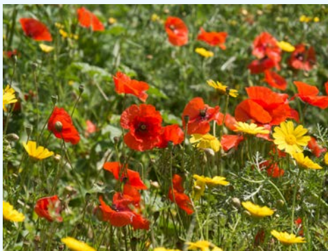
Blumenvielfalt um Paphos

aus dem Schaum des Meeres geboren worden sein soll. Danach entdecken Sie die imposanten Ausgrabungen des antiken Königreiches Kourion mit seinen wunderschönen Mosaiken im Haus des Eustolios. Vom römischen Amphitheater aus, welches in seiner Blütezeit Platz für ca. 20.000 Menschen bot, haben Sie einen herrlichen Blick auf das Meer! Durch eine bezaubernde Weinregion führt die Fahrt weiter nach Omodhos. Sie besichtigen das Kloster zum Heiligen Kreuz, entdecken bei einem Spaziergang durch die engen Gassen traditionelle Häuser und schöne Innenhöfe und probieren lokale Tropfen. In Episkopi werden Sie bereits von Christos erwartet, der Sie persönlich durch seinen Öko-Garten führt. Hier wachsen und gedeihen Thymian, Oregano, Physalis und Zitronengras. Christos betreibt Permakultur, d.h. alles erfolgt im Einklang mit der Natur. Sie probieren im Anschluss daran eine Tasse Kräuter- oder Früchtetee und probieren die hausgemachte Öko-Marmelade.