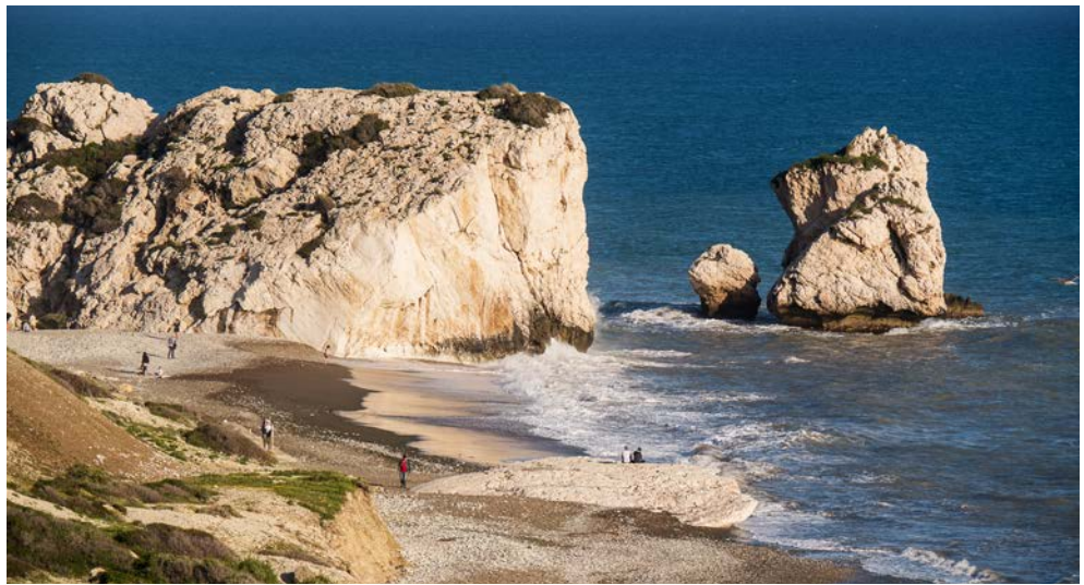
Blick auf den Felsen der Aphrodite

Diese besondere Gartenreise führt Sie auf die drittgrößte Insel des östlichen Mittelmeeres. Die Sonne scheint hier ca. 300 Tage im Jahr – beste Voraussetzungen für die über 1.500 beheimateten Pflanzenarten, darunter Wildorchideen, Affodill und Chrysanthemen. Im Frühling zeigt sich Zypern von seiner grünen Seite – überall summt und brummt es, Kräuter wachsen und Wildblumen blühen. Die Luft ist erfüllt von einem ganz besonderen Duft – denn auch die Kirsch- und Mandelblüten sind voll im Gange. Zitrusfrüchte und diverse Gemüsesorten, darunter die aromatische „rote“ Kartoffel gedeihen prächtig. Selbstverständlich dürfen Sie all die Köstlichkeiten probieren! Sie unternehmen Spaziergänge auf der Akamas Halbinsel und im Troodos Gebirge, lernen Flora und Fauna kennen, wandeln durch Kräutergärten und entdecken die jahrtausendealte Geschichte und Kultur Zyperns. Daneben wird Ihnen auch die jüngere Geschichte der Insel, die seit 1974 in den türkisch besetzten Teil und die Republik Zypern geteilt ist, nähergebracht – ein interessanter geschichtlicher Exkurs. Lassen Sie sich von der herzlichen Gastfreundschaft verzaubern! „Kopiaste“ – was so viel bedeutet wie „Willkommen, sei unser Gast.“