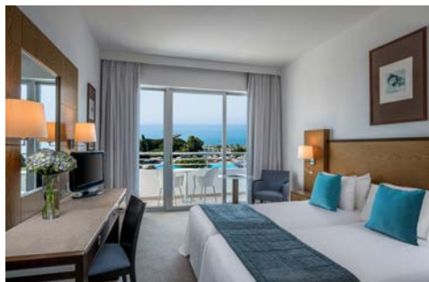
Zimmerbeispiel – Mediterran

Das am Sandstrand gelegene Hotel Mediterranean Beach (Landeskategorie: 4 Sterne) in Limassol verfügt über 5 Restaurants, welche für ihr kulinarisches Wohlergehen sorgen. Darüber hinaus können Sie vor Ort Freizeitangebote wie Innen- & Außenpool, Fitnesscenter oder Sauna nutzen. Im hoteleigenen „Aquam Helth Spa“ können Sie diverse Behandlungsangebote und Therapien genießen. Alle Zimmer sind klimatisiert und mit TV, Minibar, Safe, Balkon und kostenfreiem WLAN ausgestattet.