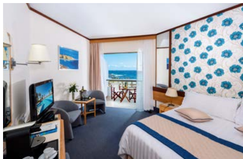
Zimmerbeispiel Standard – Athena Beach Hotel

Das Athena Beach Hotel (Landeskategorie: 4 Sterne) in Paphos besticht durch seine zentrale Lage zu den wichtigsten Sehenswürdigkeiten. Die Anlage verfügt über 3 Süßwasserpools, sowie Innen- und Außen Jacuzzis und ein hauseigener Elixir Spa-Bereich mit Sauna. Entspannen Sie im beheizten Pool oder genießen Sie ein Abendessen in gemütlicher Atmosphäre im hauseigenen Restaurant. Jedes der klimatisierten Gästezimmer verfügt über einen Balkon, Minibar, Haartrockner und Safe