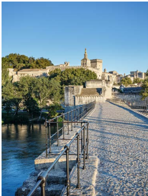
Blick auf Avignon