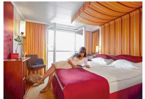
Kabinenbeispiel Kat. C/D

*Die Getränke sind bei A-ROSA ganztags inbegriffen: Tee, Kaffee und Kaffeespezialitäten, Softdrinks, Biere sowie Sekt und eine Auswahl an Weinen, Cocktails und Longdrinks. Auch außerhalb der Tischzeiten. Ausgenommen sind aufpreispflichtige Spezialitäten und Getränke sowie Champagner. Nur für den eigenen Verzehr bestimmt.