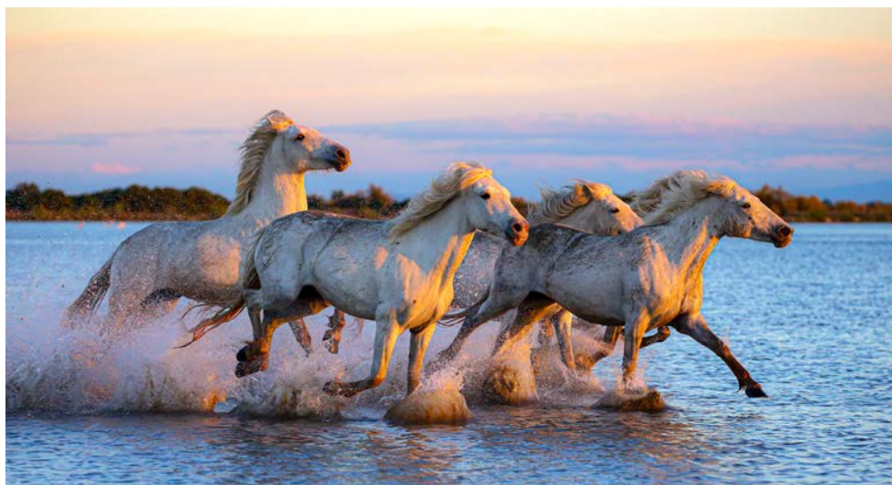
Wildpferde in der Camargue

Südfrankreich ist seit jeher ein Sehnsuchtsort für viele Reisende. Das Licht taucht die Landschaft in leuchtende Farben, die schon Picasso, Van Gogh und Henri Matisse inspirierte. Freuen Sie sich auf mediterranes Klima, köstliche Weine und eine fantastische Küche. Genießen Sie dies an Bord der A-ROSA STELLA mit all Ihren Sinnen. Das mittelalterlich-barock-moderne Lyon ist Start- und Endpunkt Ihrer Reise, von wo aus es nach den ersten Tagen auf der Saône weiter Richtung Süden in die malerische Provence geht. Avignon, Stadt der früheren Päpste, und Arles mit altrömischer Architektur werden Sie begeistern.