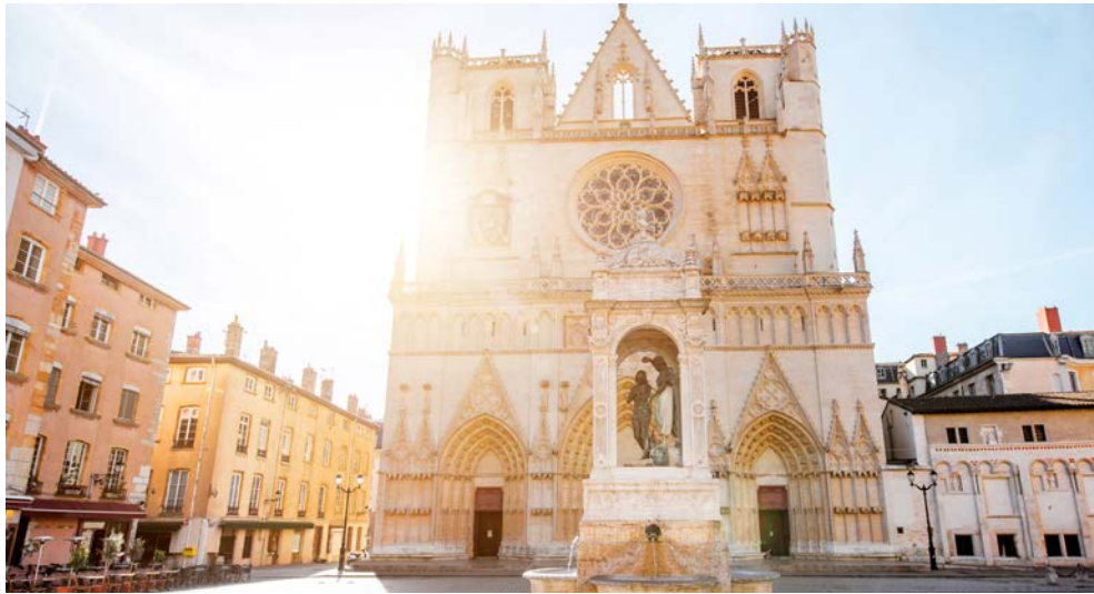
Die Altstadt von Lyon