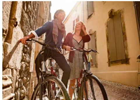
Wie wäre es mit einer Radtour?

Heute heißt es leider „Au revoir!“ – Sie gehen von Bord der A-ROSA STELLA. In Ihrem Koffer nehmen Sie die herrlichsten Eindrücke mit.