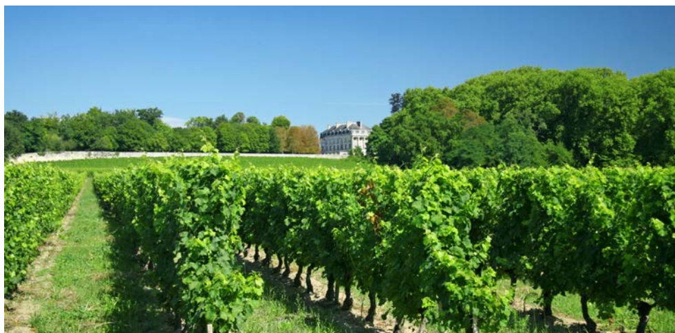
Weinregion Châteauneuf du Pape