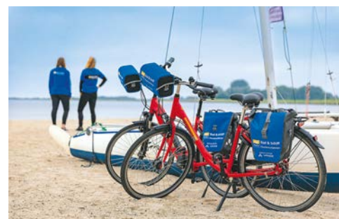
Unterwegs mit dem Mietfahrrad

Freuen Sie sich am heutigen Tag auf eine außergewöhnlich schöne Radrundtour auf der größten niederländischen Nordseeinsel Texel. Verschiedene Routen von ca. 29 bis 70 km stehen zur Wahl. Gegen Abend geht es dann per Schiff weiter nach Den Helder.