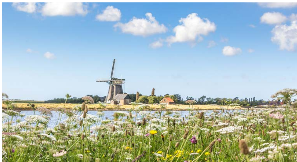
Idyllische Landschaft auf Texel

Einige Stopps dienen nur zur Ausflugsabwicklung