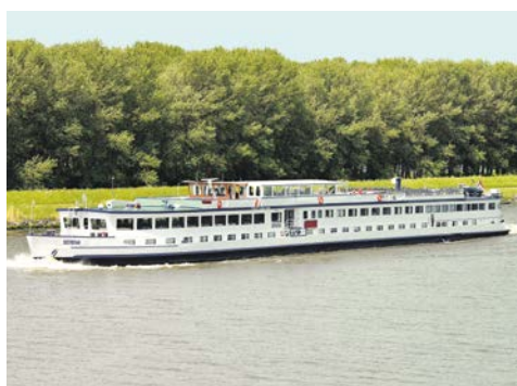
Willkommen auf der SERENA