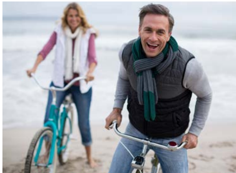
Eine kurze Auszeit am Meer

Am Vormittag fahren Sie mit dem Rad durch die Dünen nach Alkmaar. Es besteht die Möglichkeit in St. Maartensvlotbrug wieder an Bord der SERENA zu gehen und nach Alkmaar zu fahren. Oder die Radtour erst in St. Maartensvlotbrug zu beginnen.