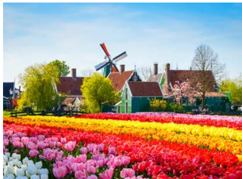
Zaanse Schans – Ein Besuch ist lohnenswert