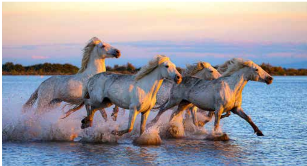
Wildpferde in der Camargue

Südfrankreich ist seit jeher ein Sehnsuchtsort für viele Reisende. Das Licht taucht die Landschaft in leuchtende Farben, die schon Picasso, Van Gogh und Henri Matisse inspirierte. Freuen Sie sich auf mediterranes Klima, köstliche Weine und eine fantastische Küche. Genießen Sie dies an Bord der A-ROSA STELLA mit all Ihren Sinnen. Das mittelalterlich-barock-moderne Lyon ist Start- und Endpunkt Ihrer Reise, von wo aus es nach den ersten Tagen auf der Saône weiter Richtung Süden in die malerische Provence geht. Avignon, Stadt der früheren Päpste, und Arles mit altrömischer Architektur werden Sie begeistern.