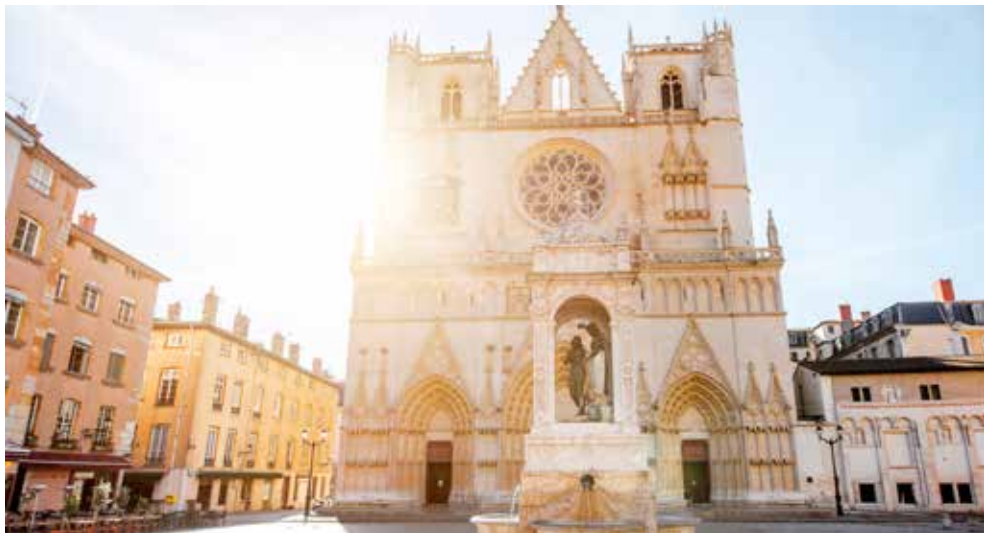
Die Altstadt von Lyon