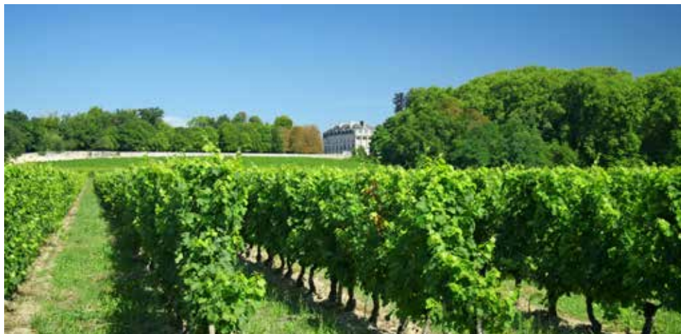
Weinregion Châteauneuf du Pape