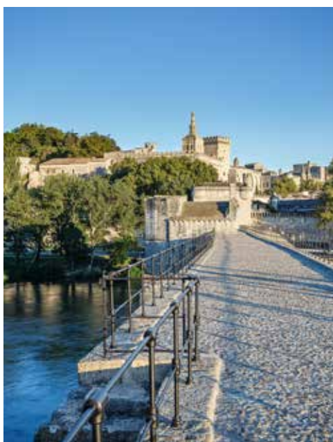
Blick auf Avignon