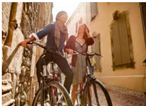
Wie wäre es mit einer Radtour?

Heute heißt es leider „Au revoir!“ – Sie gehen von Bord der A-ROSA STELLA. In Ihrem Koffer nehmen Sie die herrlichsten Eindrücke mit.