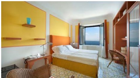
Zimmerbeispiel – Standard mit Meerblick

Von der Terrasse bietet sich ein grandioser Ausblick auf die umliegende Landschaft und das Meer. Im Restaurant kosten Sie exquisite regionale und internationale Gerichte.