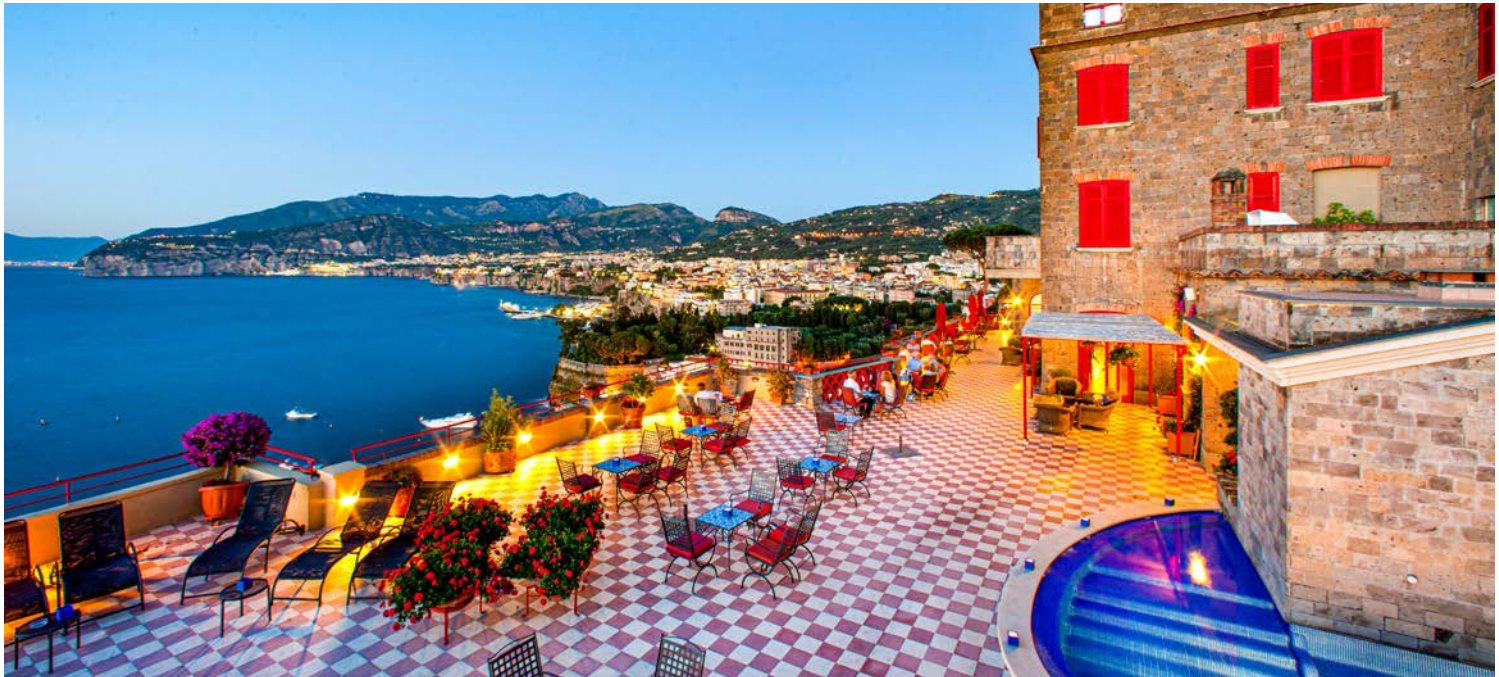
Das Hotel Minerva