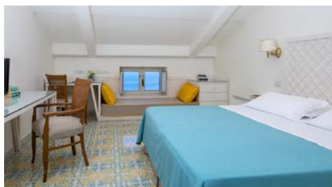
Zimmerbeispiel – Standard mit Meerblick

Genießen Sie von dem bereits 1875 erbauten Hotel Minerva die herrliche Aussicht über Sorrent und den Golf von Neapel. Die Altstadt von Sorrent erreichen Sie in fußläufiger Entfernung. Das Ambiente des in die Felsen auf verschiedenen Ebenen gebauten Hotels, besticht durch ein frisches, modernes Design in hellen und leuchtenden Farben. Alle 60 Zimmer sind geräumig und verfügen über eine kombinierte Heizung/Klimaanlage, Safe, Sat-TV, Minibar und ein eigenes Bad mit Haartrockner. Alle Zimmer haben Meerblick. Die Superior-Zimmer verfügen über einen eigenen Balkon.