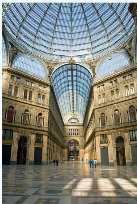
Passage Galleria Umberto I in Neapel

Das traditionsreiche Hotel Minerva aus dem Jahr 1878 öffnet seine Pforten über die Festtage! Der Ausblick von der Terrasse auf den Golf von Neapel und den Vesuv ist Balsam für unsere Seele in diesen turbulenten Zeiten!