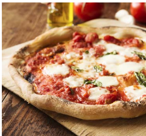
Ein Klassiker – Pizza Napoletana

Nachdem Sie in der Hauptstadt Kampaniens gelandet sind, erkunden Sie Neapel auf einem Stadtrundgang. Sie spazieren durch das monumentale Neapel – vorbei an dem berühmten Opernhaus Teatro San Carlo aus dem Jahre 1737, welches mit seinen 3.300 Plätzen jahrelang zu den größten und angesehensten Opernhäusern der Welt gehörte zur weitläufigen Piazza del Plebiscito. Im 19. Jahrhundert wurde sie für Aufmärsche und Feste genutzt, heute ist sie beliebte Flaniermeile. An deren Ende befindet sich der Palazzo Reale – der Königspalast aus dem 17. Jahrhundert. Danach werfen Sie noch einen Blick in die wunderschöne Einkaufspassage Galleria Umberto I. Sie wurde in den Jahren 1887-1890 erbaut und ist von einer großen Glaskuppel überdacht. In ihrem Inneren finden sich zahlreiche Mosaik- und Ornamente. Abschließend darf das berühmteste Gericht der Stadt nicht fehlen. Ende 2017 wurde die neapolitanische Pizza von der UNESCO zum Weltkulturerbe erklärt – Neapel gilt als Wiege der Pizza. Frisch gestärkt geht es nun zu Ihrem Hotel Minerva in Sorrent. Über der Stadt gelegen, bietet das komfortable Domizil einen herrlichen Blick auf den Golf von Neapel. Nach dem Begrüßungsgetränk wird Ihnen das Abendessen im Hotelrestaurant serviert.