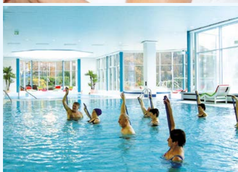
Tun Sie sich etwas Gutes