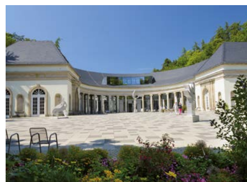
Die Wandelhalle im Kurpark