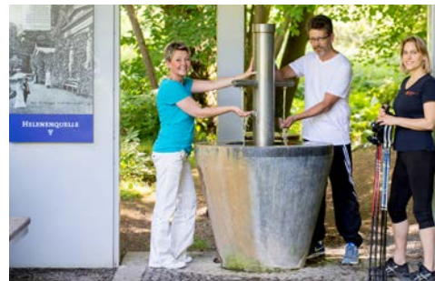
Gesundheitszentrum Helenenquelle - Willkommen!