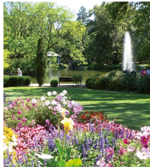
Unbedingt einen Spaziergang wert – der Kurpark

Majestätisch thront das Schloss Friedrichstein über der Stadt Bad Wildungen und ist auch schon von Weitem gut zu erkennen. Heute befindet sich hier ein Teil der Museumslandschaft Hessen-Kassel mit Sammlungen aus der hessischen Militär- und Jagdgeschichte. Kaffee und Kuchen können Sie im Schlosscafé genießen, welches in den Sommermonaten die Türen zur Terrasse des Südflügels öffnet und einen schönen Blick auf Bad Wildungen frei gibt.