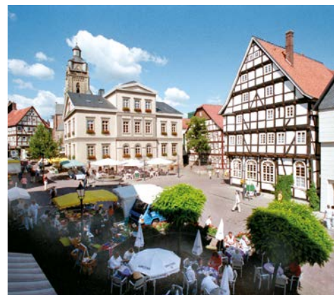
Marktplatz in Bad Wildungen