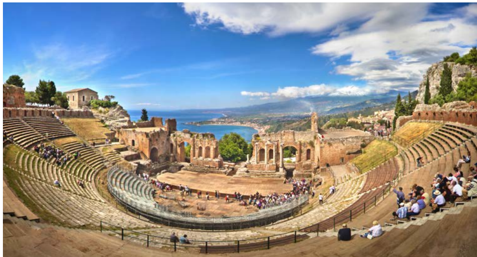
Antikes Theater von Taormina

Sizilien ist reich an herrlichen Landschaften und Kulturdenkmälern aus der wechselvollen Geschichte, in der viele Völker ihre Spuren hinterlassen haben. Von griechischen Tempeln, römischen Denkmälern bis hin zu barocken Domen, bietet Ihnen die stolze Insel eine Vielzahl an Sehenswürdigkeiten. Dazu kommt die herrliche Landschaft am Fuße des Ätna. Auf den fruchtbaren Böden wachsen im Frühjahr Orangen und Zitronen, die Weinernte beginnt schon früh im Herbst. Entdecken Sie mit uns neben den bekanntesten Sehenswürdigkeiten auch die unbekanntesten, typisch sizilianischen Ecken Siziliens. Sie sehen malerische Ortschaften und Dörfer an der Küste und im Hinterland.