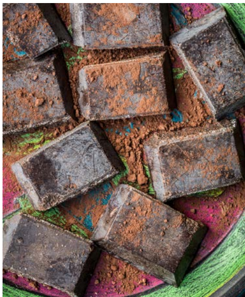
Cioccolato di Modica

Heute wechseln Sie Ihr Quartier Richtung Süd-sizilien. Zuerst fahren Sie nach Noto, eines der schönsten Wahrzeichen des sizilianischen Barocks und UNESCO Welterbe. Während eines Stadtrundgangs können Sie die wunderschönen Barockkirchen und Fassaden der Adelspaläste bewundern. Weiterfahrt zur ehemals griechischen Stadt „Siracusa“ mit ihren barocken Prachtbauten und Zeugnissen der Antike. Zu ihr gehört auch die Halbinsel Ortigia, die eigentliche Altstadt, die durch eine Brücke mit dem Festland verbunden ist. Bei einem ausgedehnten Spaziergang sehen Sie u.a. die Arethusa-Quelle (Süßwasserquelle und heute Treffpunkt der Jugend) und den berühmten, ehemaligen Athenatempel. Das griechische Theater und das römische Amphitheater im archäologischen Park zeugen von der kulturellen Blütezeit.