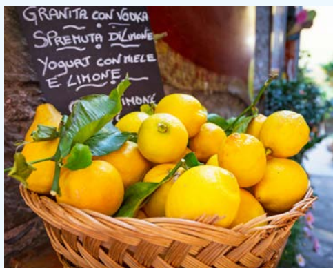
Zitronen gedeihen hier prächtig